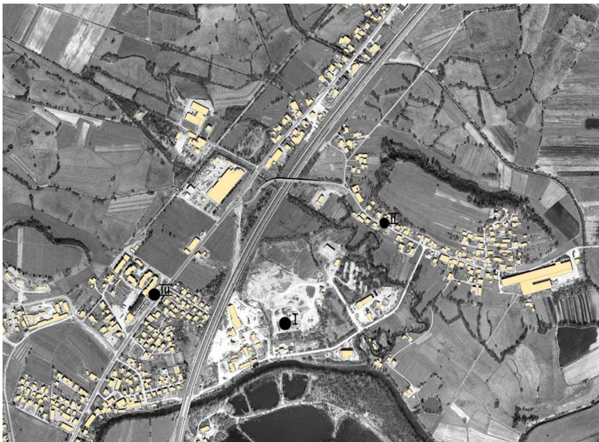
Slika 2: Slika Vrhnike z označbami vzorčevalnih mest (I – kompostarna, II – Sinja Gorica 32, III – bloki Vrtnarija)

Meritve so se izvajale v dopoldanskem času, med mešanjem kupov komposta. Takrat so namreč v zrak izpuščene vonjave najbolj izrazite.