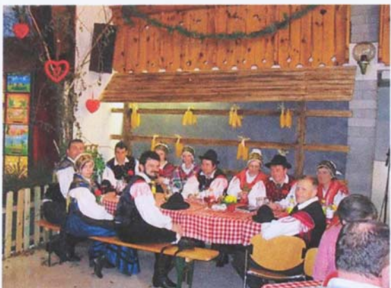
Snemanje TV oddaj: Prvi na vasi