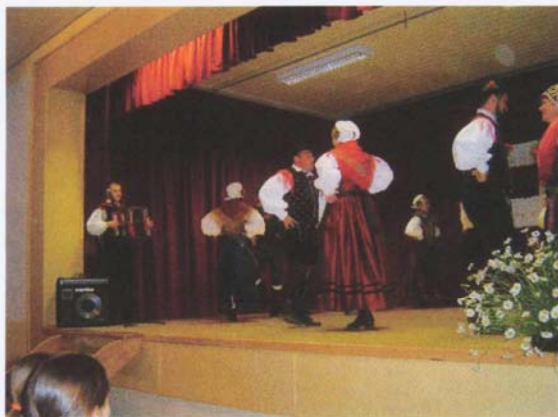
Celovečeren nastop ob otvoritvi prenovljene dvorane v Gasilskem domu Ligojna, 19. 5. 2007.