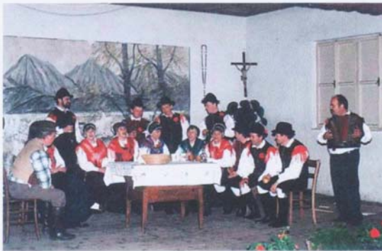
Prvi začetki nastopanja.

Pisalo se je leto 1992, ko so nekateri krajanji Ligojne začutili potrebo po ustanovitvi Kulturno umetniškega društva. Nekaj teh krajanov tudi po 16 letih, še vedno zelo aktivno sodeluje z KUD-om. Začetki so bili težki in negotovi. V tistem času je Ligojno predstavljala le Folklorna skupina , katera je začela delovati že leta 1978 in kmalu postala nepogrešljiva, tako v Ligojni kot drugod. Oblekli so se so v gorenjsko narodno nošo in plesali gorenjske ples.