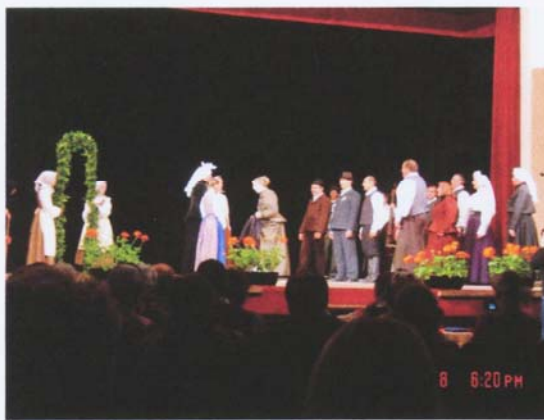
Nastop v Cankarjevem domu Vrhniki, 9. 5. 2004.