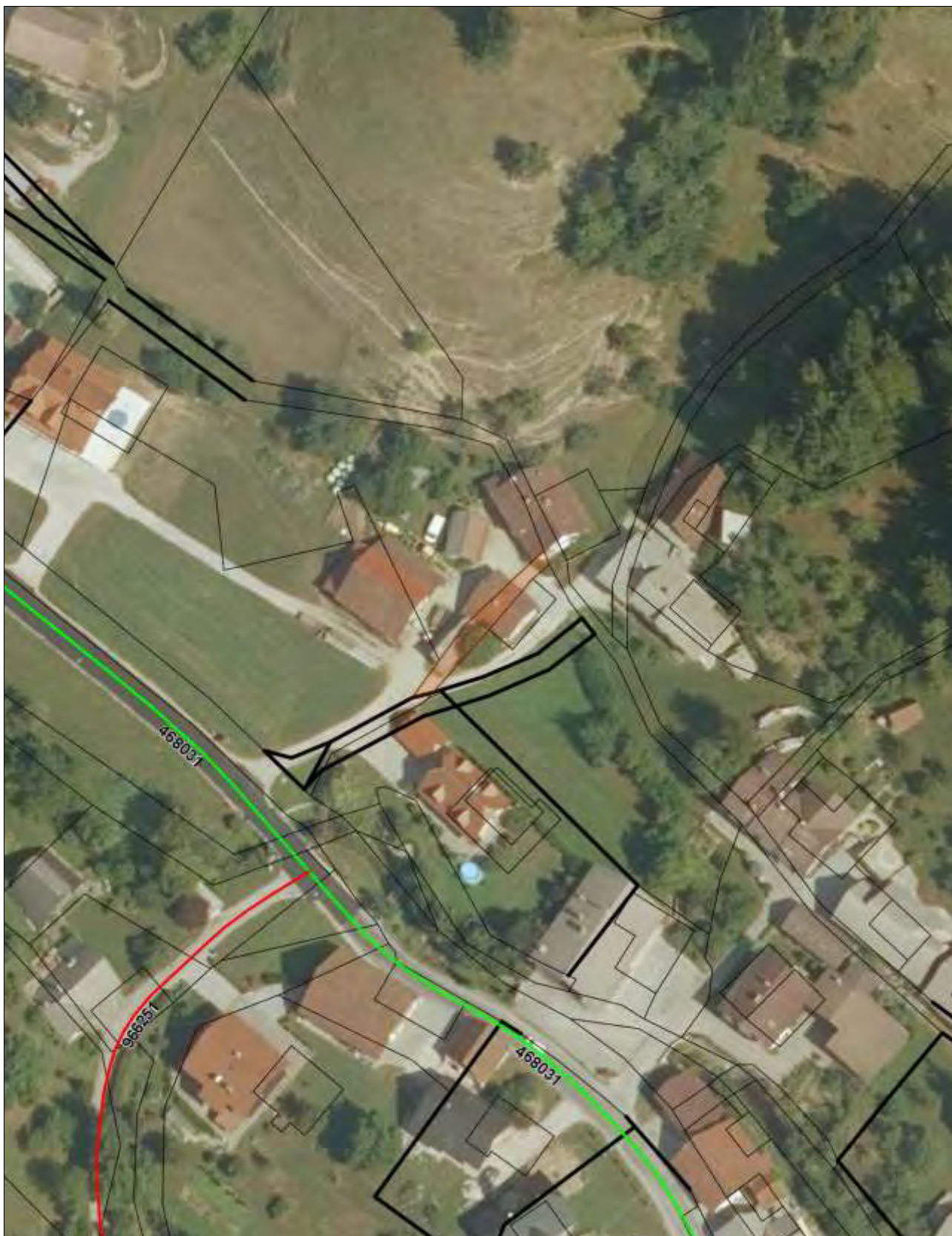
Priloga 2: Orto-foto posnetek – označeno zemljišče parc. št. 1018/2 k. o. Smrečje za izvzem iz JD (Vir: iObcina, april 2021).