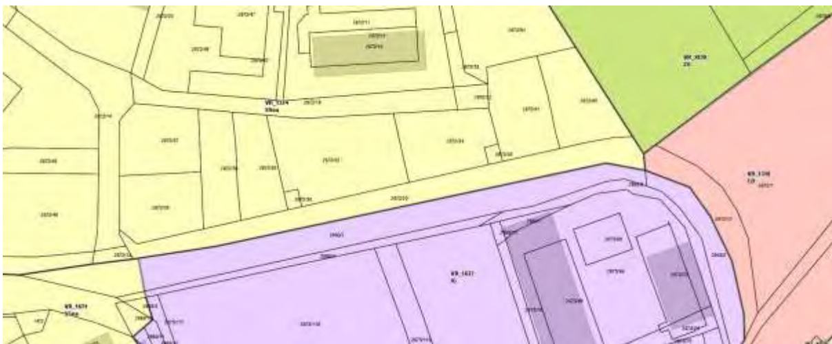
Slika: Izsek iz OPN Občine Vrhnika

Na delu območja velja Odlok o lokacijskem načrtu za rekonstrukcijo Ceste pod Hruševco (Ur. l. RS, št. 51/98, Naš časopis, št. 429/15).