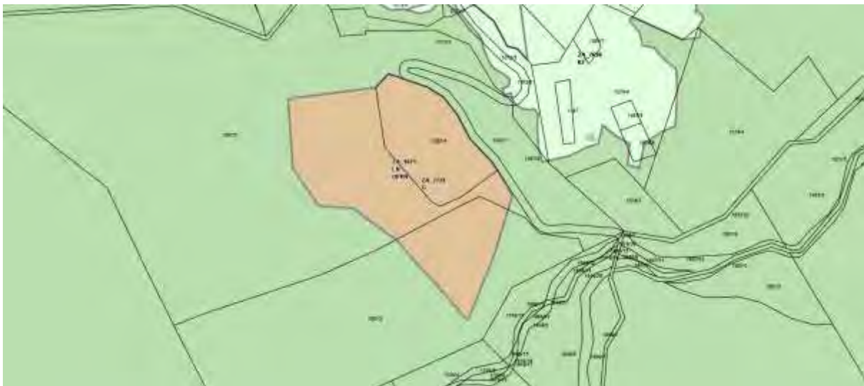
Slika: Izsek iz OPN občine Vrhnika; podrobnejša namenska raba:

Občinski prostorski načrt občine Vrhnika določa območje kamnoloma Mivšek z namensko rabo LN – območja mineralnih surovin - površine nadzemnega pridobivalnega prostora, oziroma z enoto urejanja prostora ZA_1071, ki se ureja z občinskim podrobnim prostorskim načrtom (OPPN) kamnolom Mivšek.