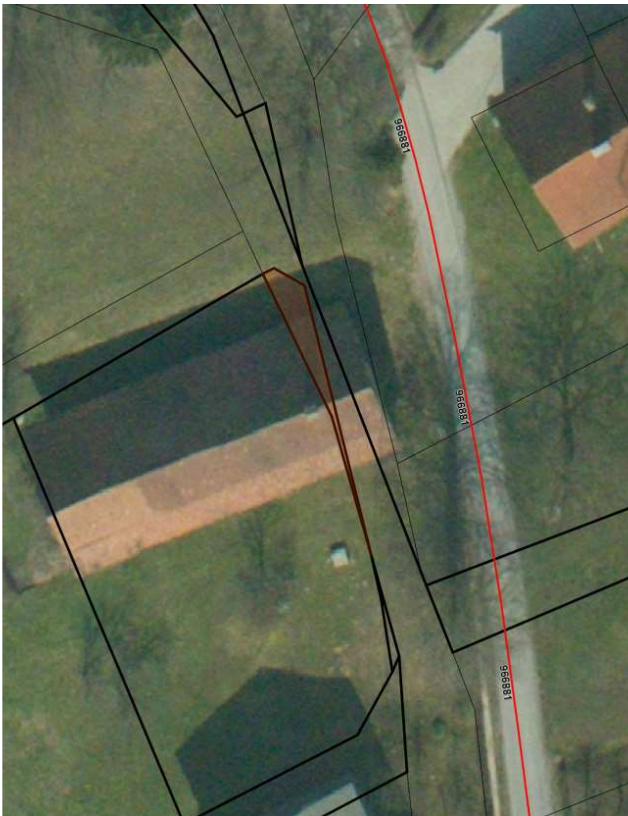
Priloga 4: Orto-foto posnetek – označeno zemljišče parc. št. 3102/6 k. o. Blatna Brezovica za izvzem iz JD (Vir: iObcina, april 2021).