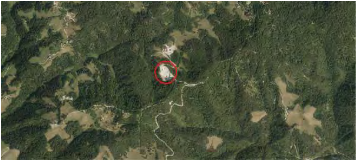
Slika: Lokacija kamnoloma Mivšek