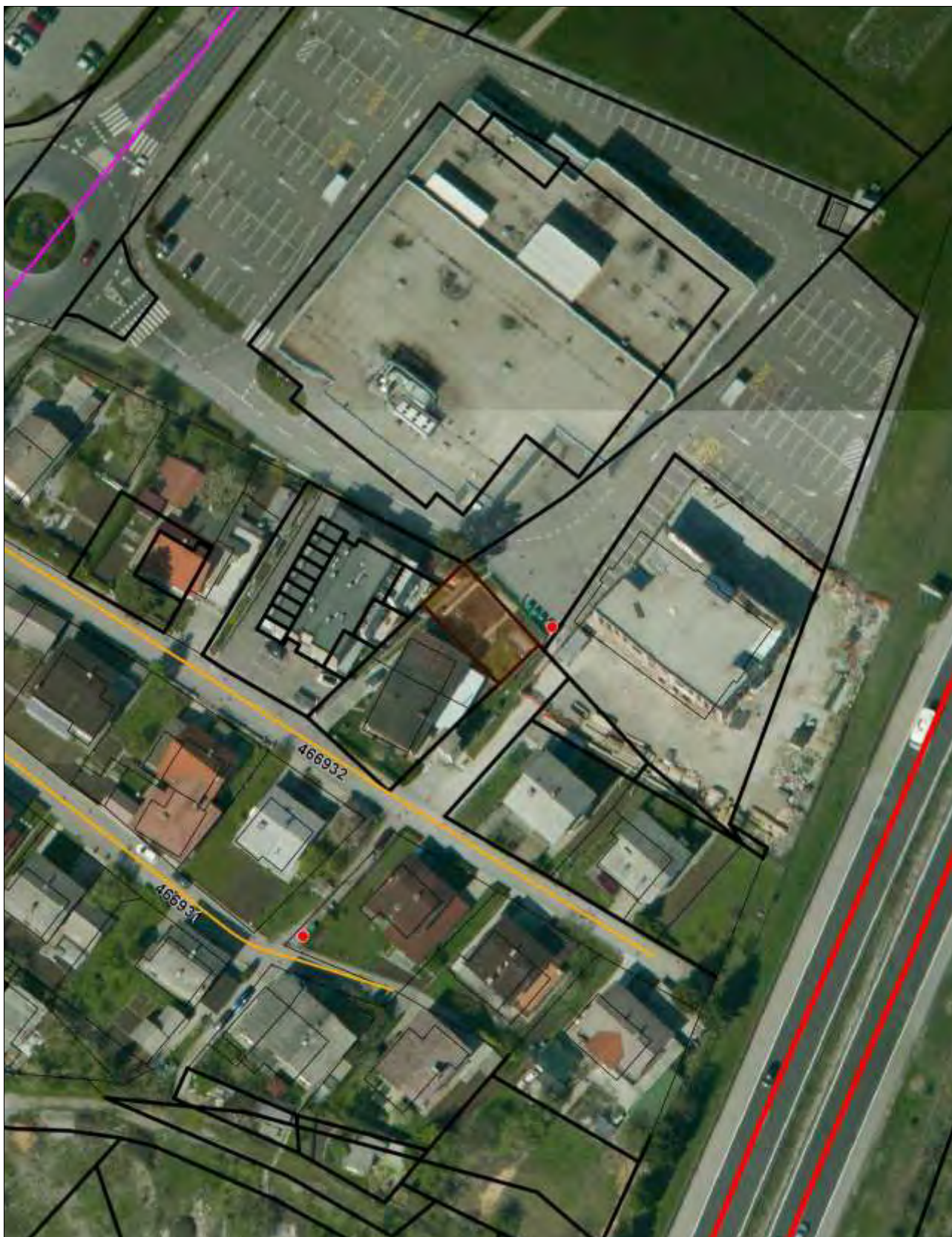
Priloga 3: Orto-foto posnetek – označeno zemljišče parc. št. 2729/20 k. o. Vrhnika za izzem iz družbene lastnine.