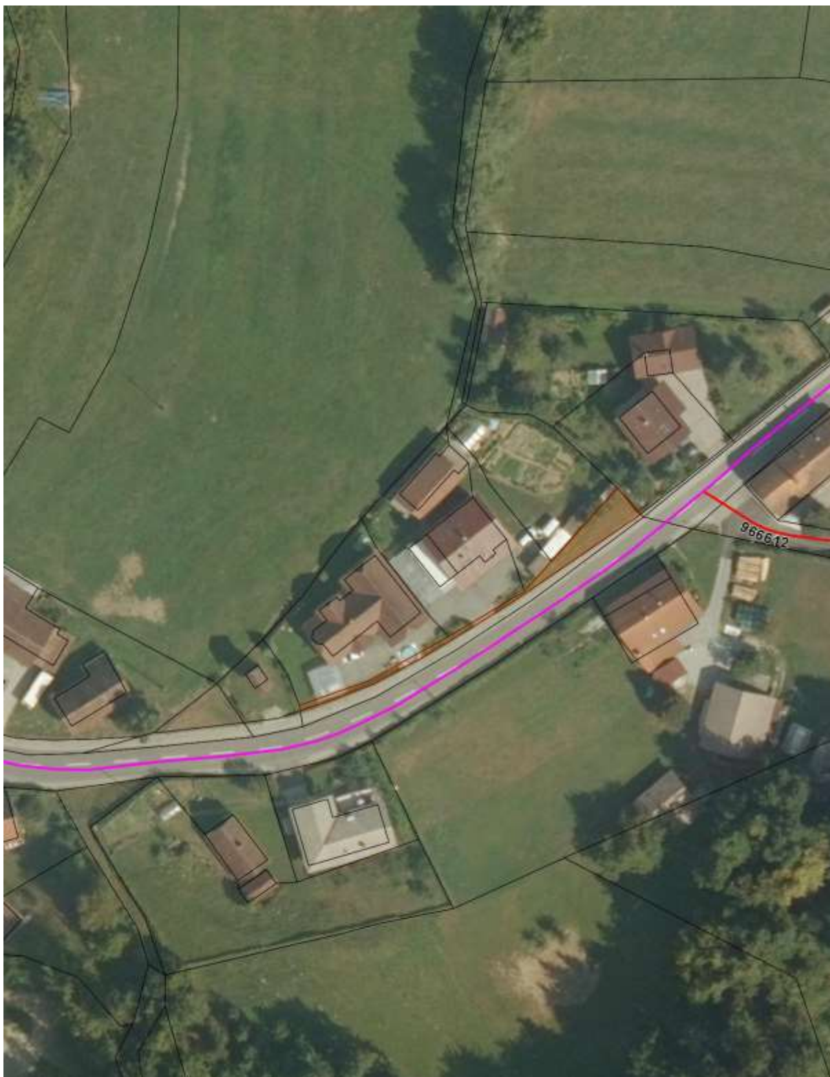
Priloga 1: Orto-foto posnetek – označeni zemljišči parc. št. 823/4, 823/6, obe k. o. Verd za izvzem iz JD.