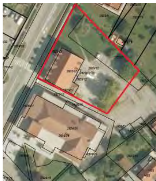
Tržaška cesta 23