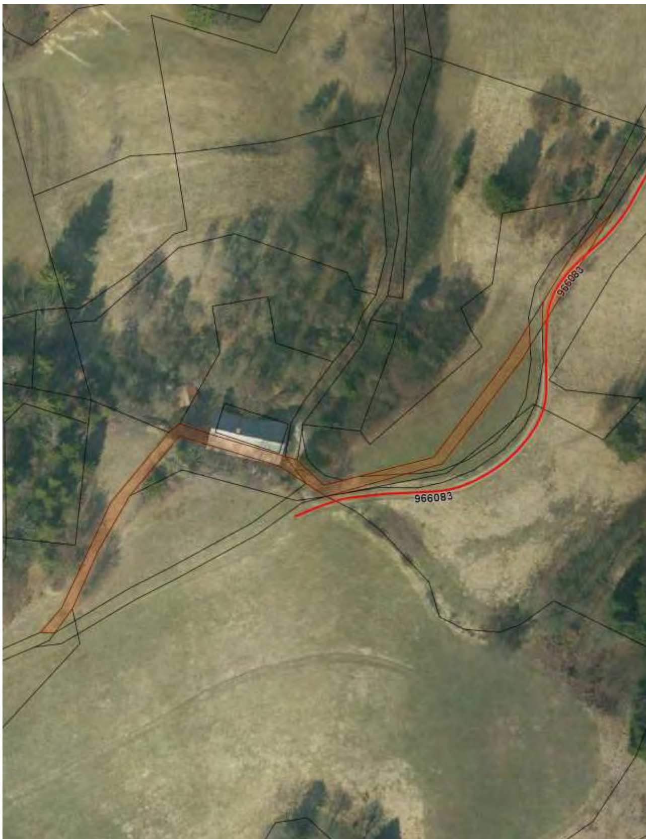
Priloga 2: Orto-foto posnetek – označena zemljišča za izvzem iz JD.