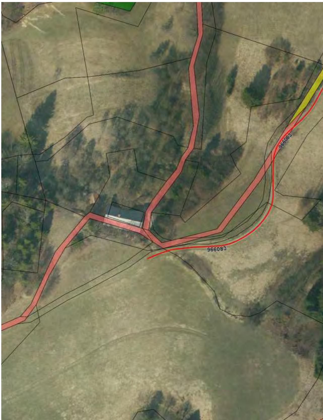
Priloga 3: Orto-foto posnetek – zemljišča označena po lastništvih. Legenda: roza – javno dobro; rumena – Občina Vrhnika, brez barve – zasebni lastnik.