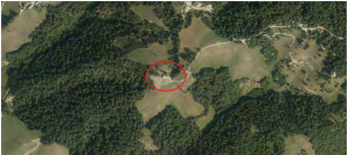
Lokacija v širšem prostoru