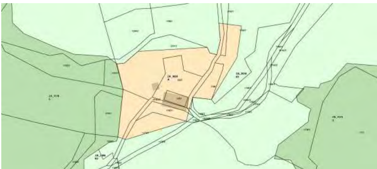
Izsek iz OPN Občine Vrhnika