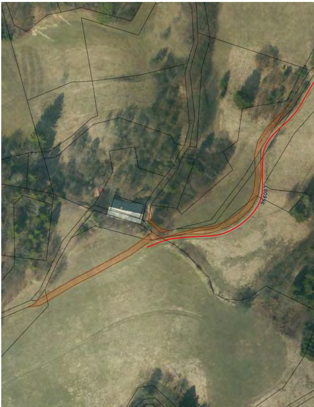
Priloga 1: Orto-foto posnetek – označena zemljišča, ki jih pridobimo.