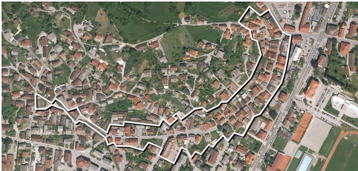
Slika: Območje OPPN Stara cesta - Vas

Območje OPPN obsega Staro cesto, Na klancu, del Robove ceste, Čužo, Pot k Trojici, Vas in Pri lipi s stavbami in zunanjimi ureditvami ob cestah.