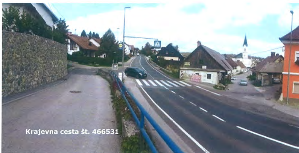
Slika 4: Območje navezave kolesarske steze na krajevno cesto 466531

Za ureditev kolesarskega in peš prometa je bilo izdelanih več variant poteka kolesarskih in peš površin. Kot najustreznejša se je izkazala varianta 3, ki se nahaja v prilogi tega gradiva.