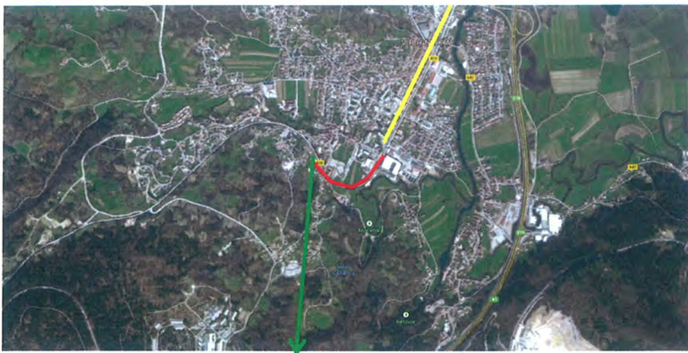
Slika 3: Prikaz zveznega poteka kolesarskih povezav (rumena črta = obstoječe kolesarske povezave, rdeča črta = obravnavan odsek kolesarskih povezav ob regionalni cesti, zelena črta = nadaljevanje daljinske kolesarske povezave po obstoječih lokalnih cestah do Logatca)