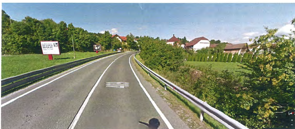
Slika 5: Območje ob regionalni cesti R2 do priključka za Močilnik (do km 1,250)

Zaradi prostorske utesnenosti in razgibane konfiguracije terena pa v zaključku obravnavanega odseka, od km 1,280 do km 1,400, trčimo v ozko obcestno pozidavo, ki zahteva rušitve obstoječih objektov, ki že danes posegajo v območje ceste in zmanjšujejo prometno varnost v tem delu naselja. Zagotavljanje zveznosti kolesarskih in peš povezav na tem odseku zahteva rušitve obstoječih stanovanjskih objektov, med katerimi je objekt Voljčeva 27, evidentiran kot objekt KD Vrhnika-Hiša Voljčeva 27, št. EŠD 12448.