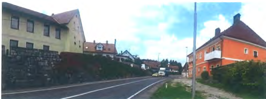
Slika 6: Območje ozke občestne pozidave ob regionalni cesti R2 (v km 1,320)