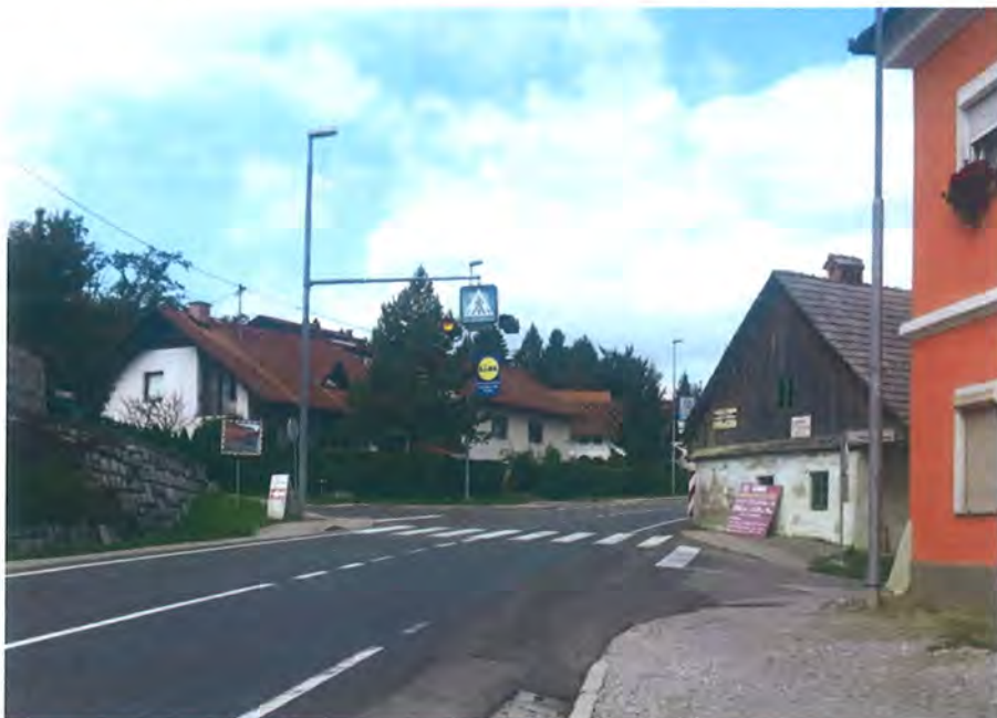
Slika 7: Lokacija objekta KD v cestnem pasu regionalne ceste

Iz navedenega razloga je bilo izdelanih več prostorskih preveritev umestitve kolesarskih in peš površin na tem pododseku. V izhodišču se je v celoti poskusilo izogniti posegu v obravnavan objekt KD, zato sta bili izdelani dve preveritvi (varianta 0.1 – s tehničnimi elementi kolesarskih stez in pločnikov kot na preostalem odseku, varianta 0.2 – z minimalnimi dopustnimi tehničnimi elementi pločnika in kolesarskih stez). Grafični prikaz obeh variant se nahaja v prilogi tega gradiva.