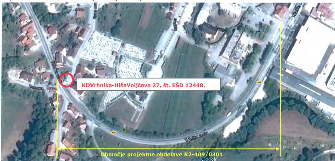
Slika 2: Pregledna situacija območja projektne obdelave, od km 0,830 do km 1,400

Tako načrtovana potek kolesarske povezave zahteva minimalno porabo prostora znotraj obstoječih prometnih koridorjev, pri čemer doseže multiplikativne učinke tako na lokalnem kot državnem nivoju.