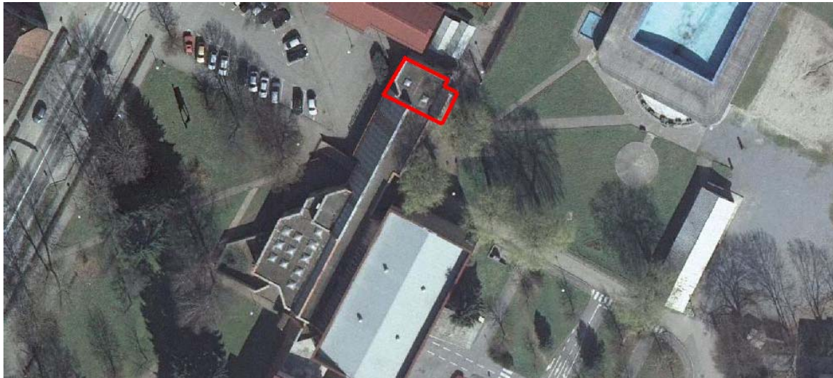
Slika 3: Del objekta, ki je predviden za rušenje.